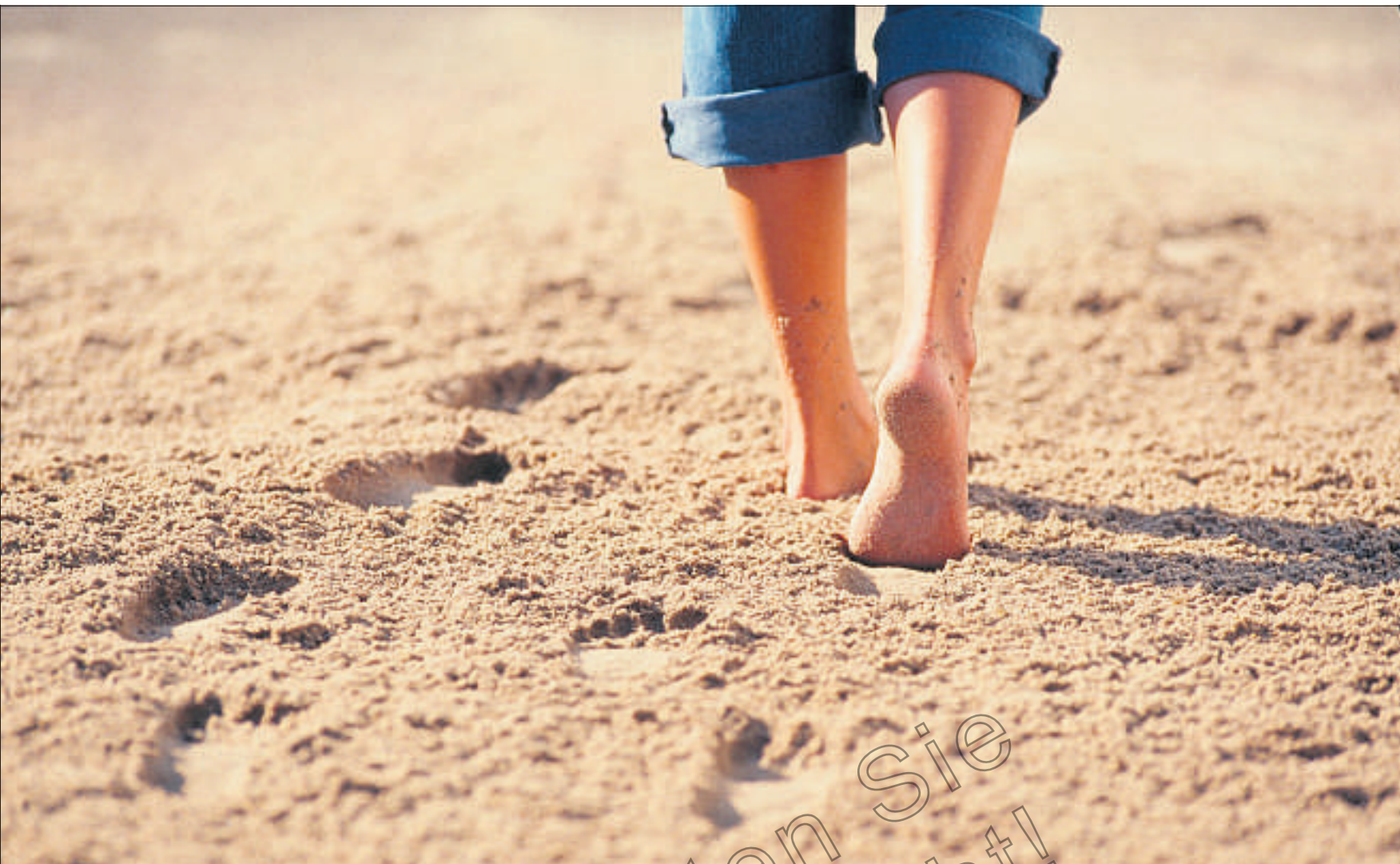
Die Natur hat uns eigentlich dazu gemacht, dass wir barfuss gehen. Das dehnt die Achillessehne und die Bänder an der Fusssohle.